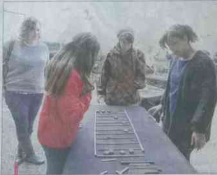
L'association Jeux Jubi ® était aussi de la partie hier au Forum des alternatives, "Act'Vivons", qui se tenait au Tri Postal.