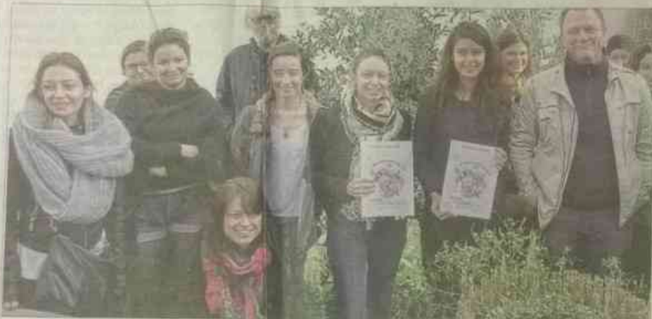
Les associations sont mobilisées pour la Semaine de l'environnement. Et ce sont les étudiantes en licence professionnelle Tourisme et économie solidaire à l'université qui ont présenté le programme de cette sixième édition.

Tout est en place pour que la Semaine de l'environnement soit un moment festif et informatif pour le plus grand nombre de Vauclusiens. Elle aura lieu du 1 er mars au 5 mars à Avignon. La présentation de ce rendez-vous a été assurée ce jeudi au Tri postal par les étudiantes en licence professionnelle Tourisme et économie solidaire à l'université d'Avignon.