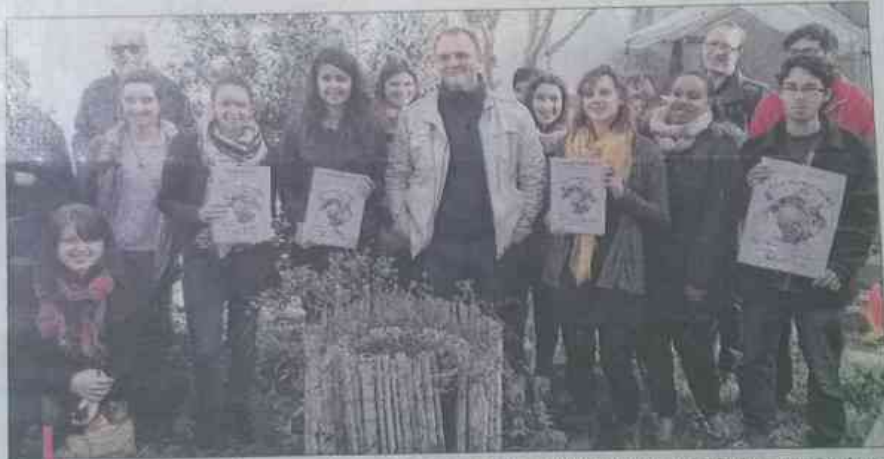
L'ensemble des organisateurs et des partenaires ont présenté l'événement qui s'étalera sur cinq jours au début du mois de mars.

Le surlendemain, le jeudi 3 mars, on pourra se glisser "dans la peau des négociateurs de la